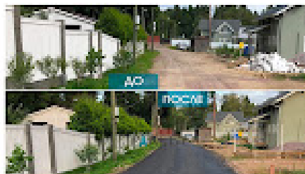
Коттеджный поселок Академические дачи пр. Смольчково