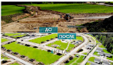
Клубный поселок Нурии Хинаас Раздольевское сельское поселение