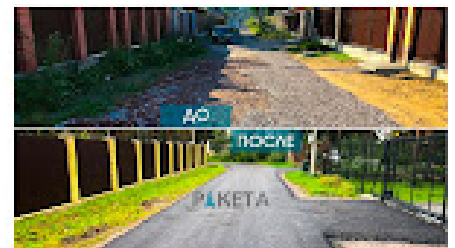
Коттеджный поселок "Памир" Сертоловское городское поселение