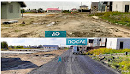
Коттеджный поселок РедВилл Кокушское сельское поселение