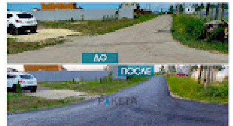
Коттеджный поселок Лесная Привлекгия Виллазовское городское поселение