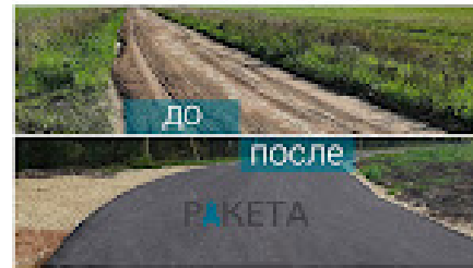
Сельхоз предприятие пос. Суйда